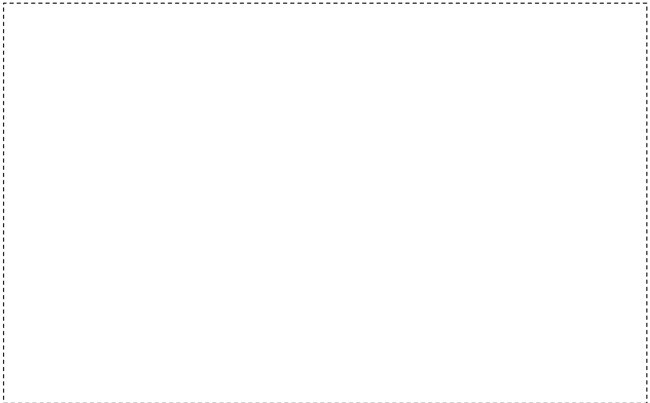
รูปที่ 2. สภาพด้านในบ้านคำบรรยาย..... .....